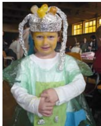
Noch nicht so ganz happy mit der Verkleidung?