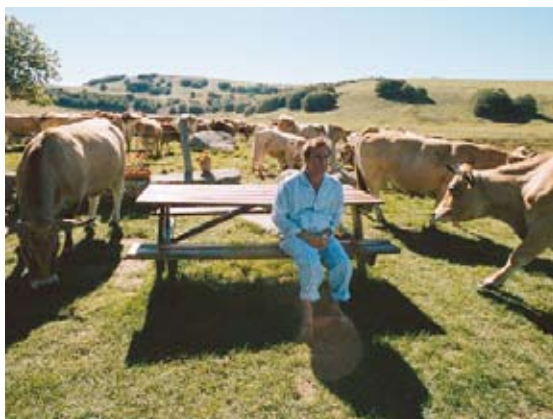
2010: Pilgern auf Französisch

Und das waren die Filme der letzten fünf Jahre: