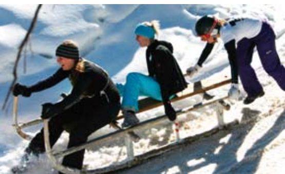
Unter den begeisterten Teilnehmern waren figurbetonte Männer und sehr sportliche Damen

Am Samstag den 5. März 2011 fand dank Neuschnee bei herrlichem Wetter und mehr als frühlingshaften Temperaturen das traditionelle Stigltreither Hornschlittenrennen statt. Den diesjährigen Teilnehmern wurde aufgrund der besonderen Schneelage vor allem im ersten Rennabschnitt so manche