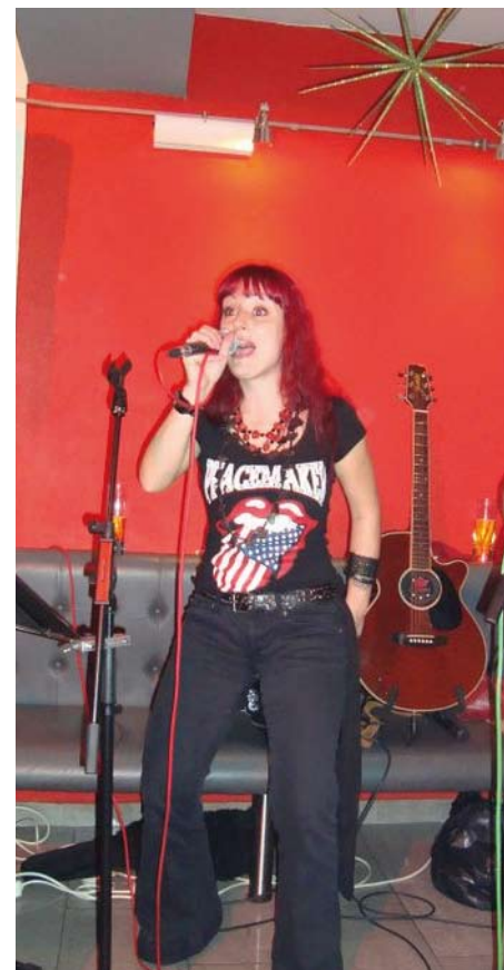
Red Sonya und Cherry Bomb