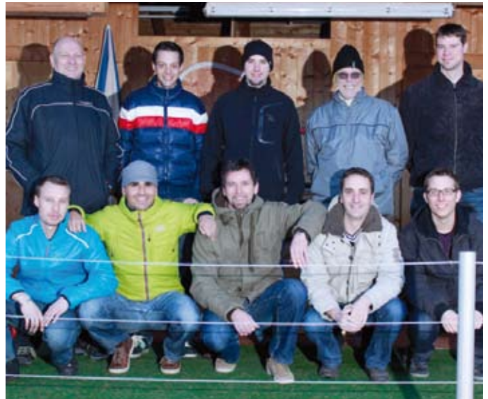
Die Sektion Tennis versucht sich an der Teilnahme zur Tennismeisterschaft