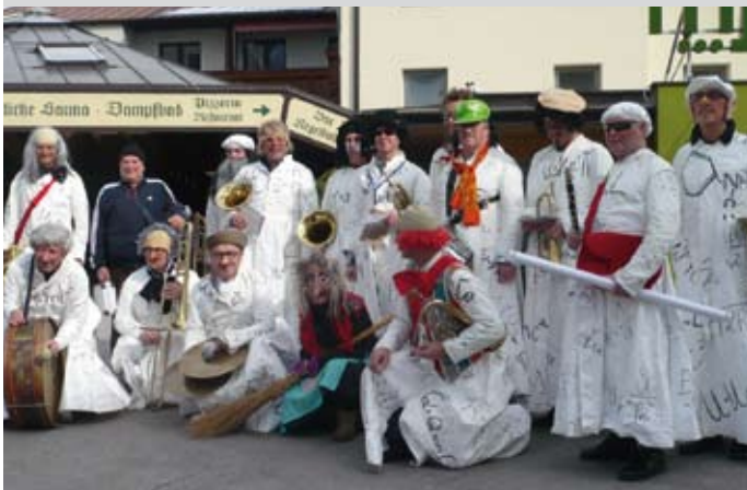
Die Maschgermusig darf beim Umzug keinesfalls fehlen