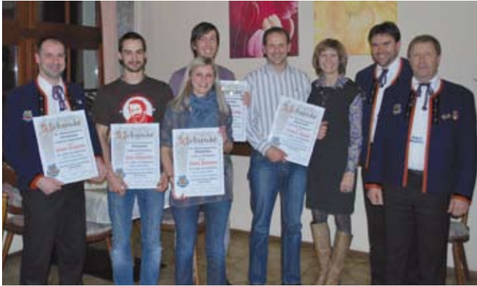
Die Geehrten für 10 jährige Mitgliedschaft

DVD als Verkaufsschlager | MGV und Plattler erobern Osttirol | Plattler verstärken sich Jungplattler mit neuem Tanz | Liederabend als Highlight 2011