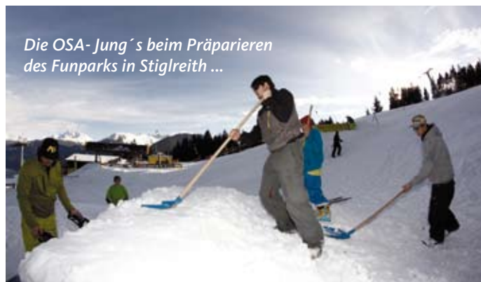
Die OSA- Jung´s beim Präparieren des Funparks in Stigleith ...