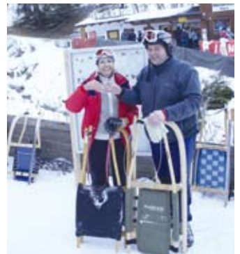
Die Bürgermeisterin und der Vize schnell unterwegs