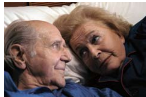
2008: Elsa und Fred