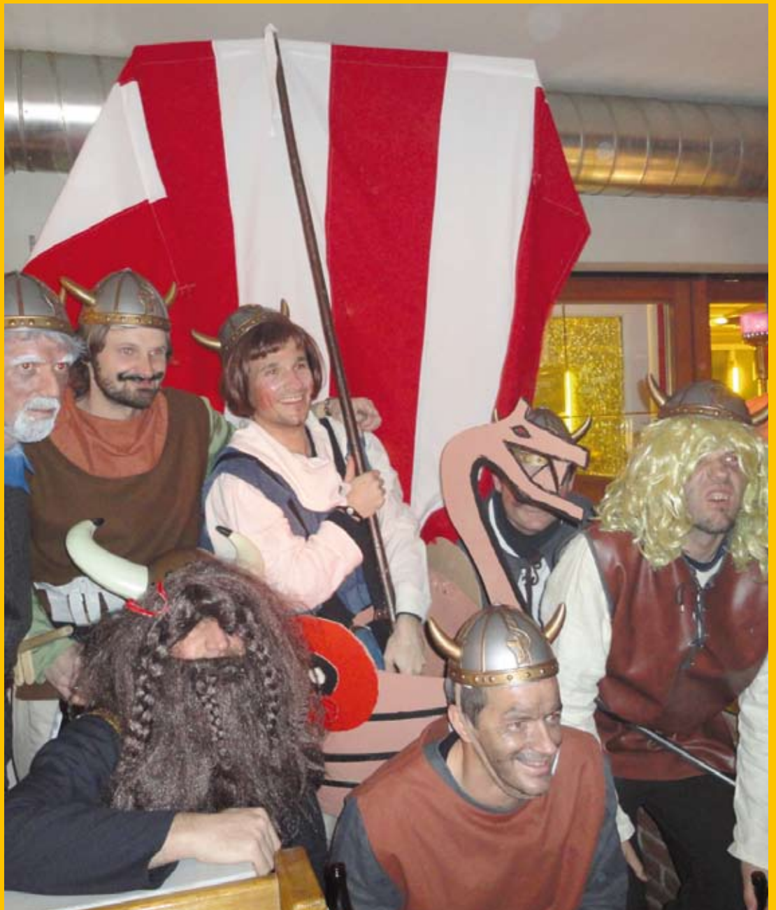
Eine Abordnung der Faschings-Wikinger – sogar mit Schiff – aus Exfußballern bzw. Schützen zogen am „Unsinnigen Donnerstag“ durch das Dorf.

Nummer 93 Erscheinungsort Oberperfuss P.b.b. Ausgabe 1/2011 23. Jahrgang März 2011 Zugestellt durch Post.at