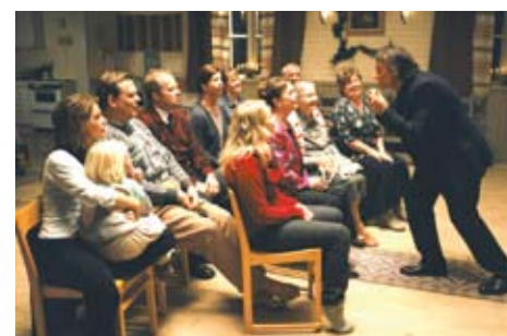
2006: Wie im Himmel