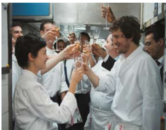
2009: Zusammen ist man weniger allein