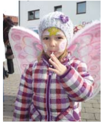
Ein Schmetterling ...