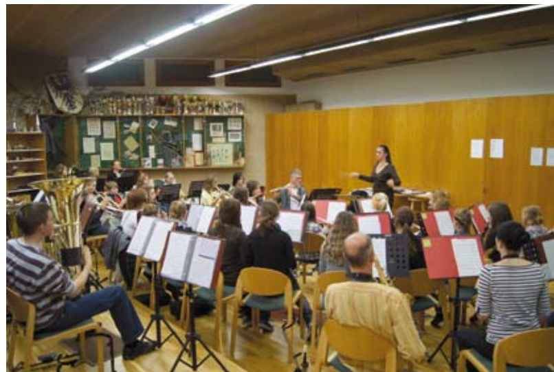
Die Jugendkapelle bei der Probenarbeit in Kematen