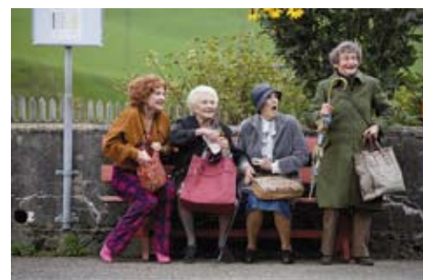
2007: Die Herbstzeitlosen