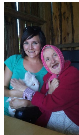
Besuch am Bauernhof „Hansilis“ in Oberperfuss