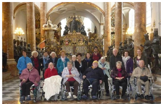
Ausflug nach Innsbruck